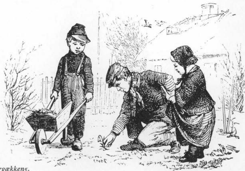
Tegning af Otto Bache 1862 til H. C. Andersens »Sommergækken«.

Vintergæk 1800ff; alle de af de følgende navne, som er belagt fra 1500–1600-t, gælder i de gamle kilder kun Dorothealiljen (s. 218). Vinterlilje 1594–o. 1880, Sønderjylland; hvid tidløs og Sankt Dorothealilje 1622, blomstrer omkring Dorotheas dag 6/2, sommerlilje o. 1664, blidelslilje o. 1700 og kyndelmisselilje o. 1700ff, ØSjælland, blomstrer omkring kyndelmisse den 2. februar ( blidel ), februarlilje o. 1700ff, ved Aalborg