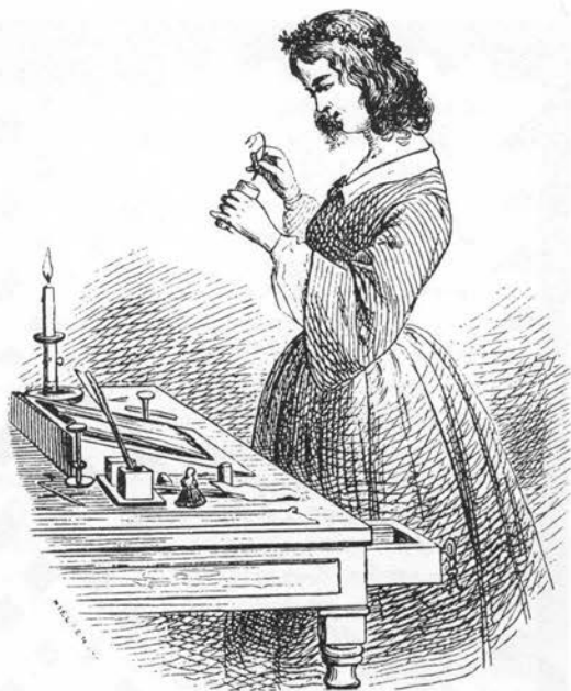
Illustration af Otto Bache 1862 til H. C. Andersens »Sommergækken«.

Jeg sender hende en gave, · en blomst af en have, · den første, der fremtræder, · en ridder i hvide klæder. · Hans kappe er grøn, · selv er han meget skøn. · En gæk lader hun sig kalde, · det