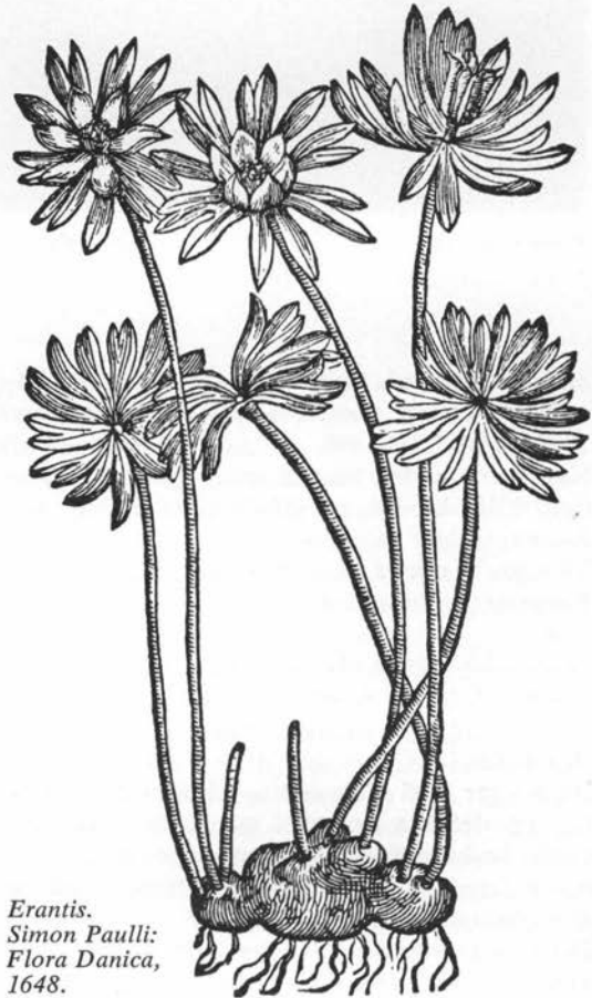
Erantis. Simon Paulli: Flora Danica, 1648.