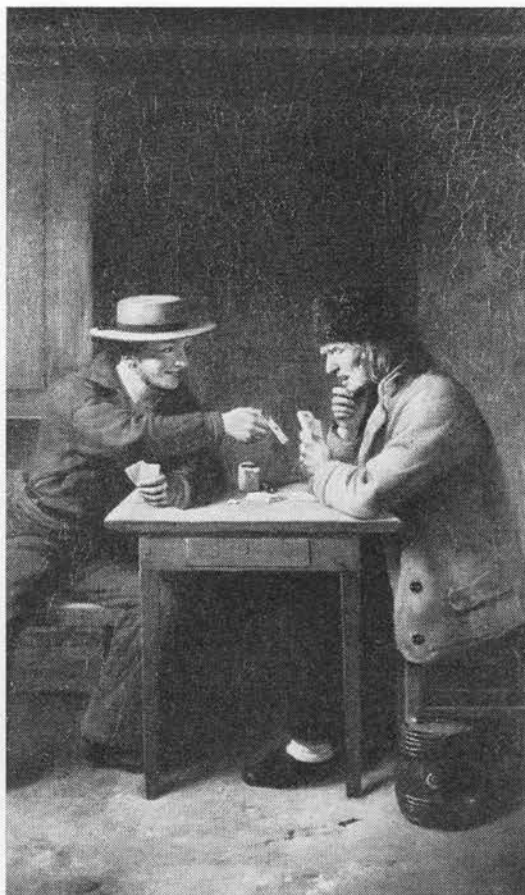
Kortspillet »klør« er afledt af plantenavnet kløver. Maleri af C. Schleisner, 1862.

RØDKLØVER (1758 rød kløvergræs), Trifolium