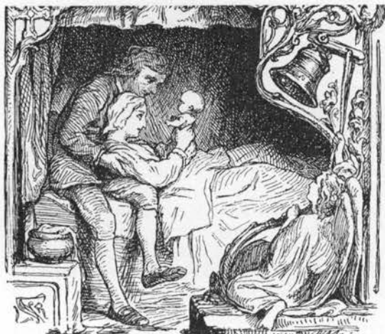
Barselskvinde tegnet af Lorenz Frölich til H. C. Andersens eventyr »Den gamle klokke«.

Det er et gammelt husråd at koge tørre skovmærker med usaltet smør til salve på hug- og stødsår, gamle sår, skab, frost, køers ømme yver og sprukne patter (1761ff; 13), på bulne fingre (NFyn; 14), brystvorter suget itu af spædbørn Fyn o. 1900; 15); i salven blandes den mellemste hyldebark og kamilleblomster (1700-t; 16).