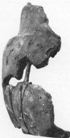
Fragment af tragtbæger fra Ertebøllertiden skåret af røn. Nationalmuseet. Overfor: Dyrehave-tjørne, forneden fuldstændig afgnavede så højt hjortene kan række. (es).

Majrøn o. 1700; Falster, Møn, afskårne grene bruges til pynt på majstangen o.a.; mannerøn o. 1700, maretræ Lolland 1800-t, marne 1875ff Lolland er påvirket af navne til mistelten (s. 330), begge planter anvendes mod mareridt. Fuglebær 1793ff, SSlesvig, Sønderjylland, ædes af fugle og benyttes til fuglefangst jf. donebær og kramsfuglebær o. 1875, fuglefængerrøn Bornholm 1882, se nedenfor; rønnemaj 1875ff; Lolland, MSjælland, majgrønt 1875ff, Lolland.