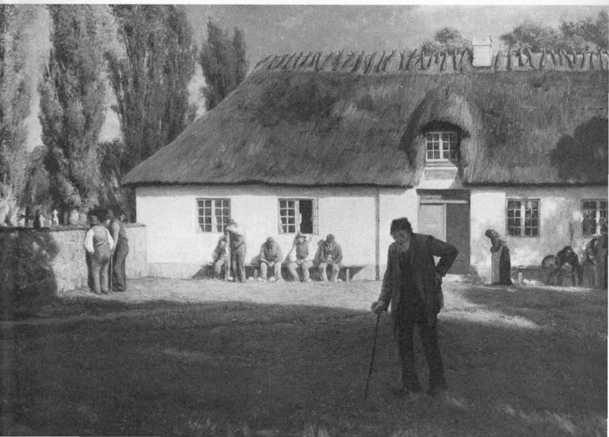
Rønnebær sat på brændevin var et yndet gigtmiddel. Maleri af C. Wentoft, 1902.

Træets unge skud eller mellembarken i rødvin indgives for kvægets blodpis (1664; 11) eller mælkeafkog af unge skud, blade eller bær (12). Rønnebær nævnes blandt råd for hestens halsbetændelse, barken mod fåresot (13), dekokt af barken anvendes mod fårets kopper (Bornholm 1756; 14). Kviste med bær ophængt i hønsehuset forebygger »pip« – forstoppelse af næseborerne, eller hønsene gives de tørrede bær opblødt i vand (15).