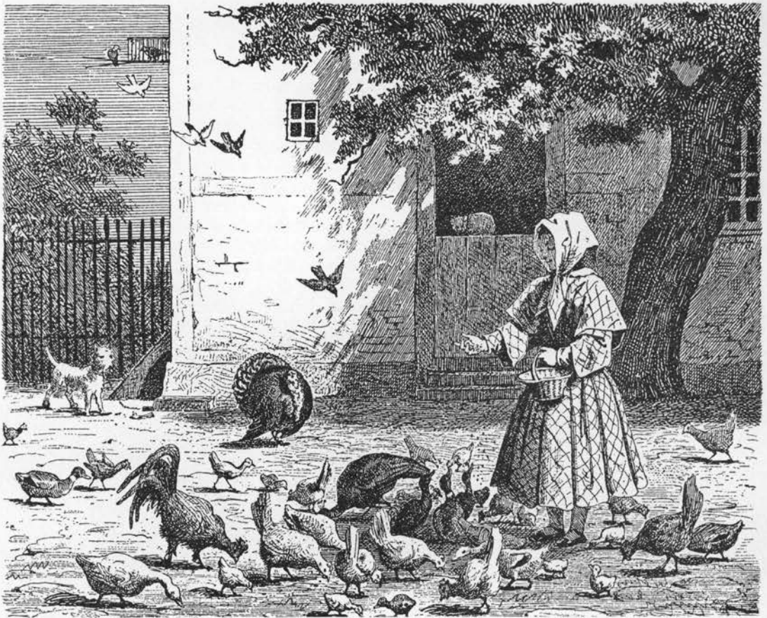
Tørrede eller friske rønnebær blev anvendt som fjerkræfoder. Tegning af Martinus Rørbye i »Femogtyve Billeder for smaa Børn«, 1846.

Nogle husmødre lægger en klase rønnebær i syltede agurker (Branderup SJylland; 21), lidt afkogt bærsaft kommer i æblekompot (22). Bærrene er også blevet brugt til vin (23) og blev under 1. verdenskrig samlet til marmelade (Sønderjylland, Slesvig; 24) og eksport (25), en del sælges på apotekerne (Dybbøl o. 1875; 26).