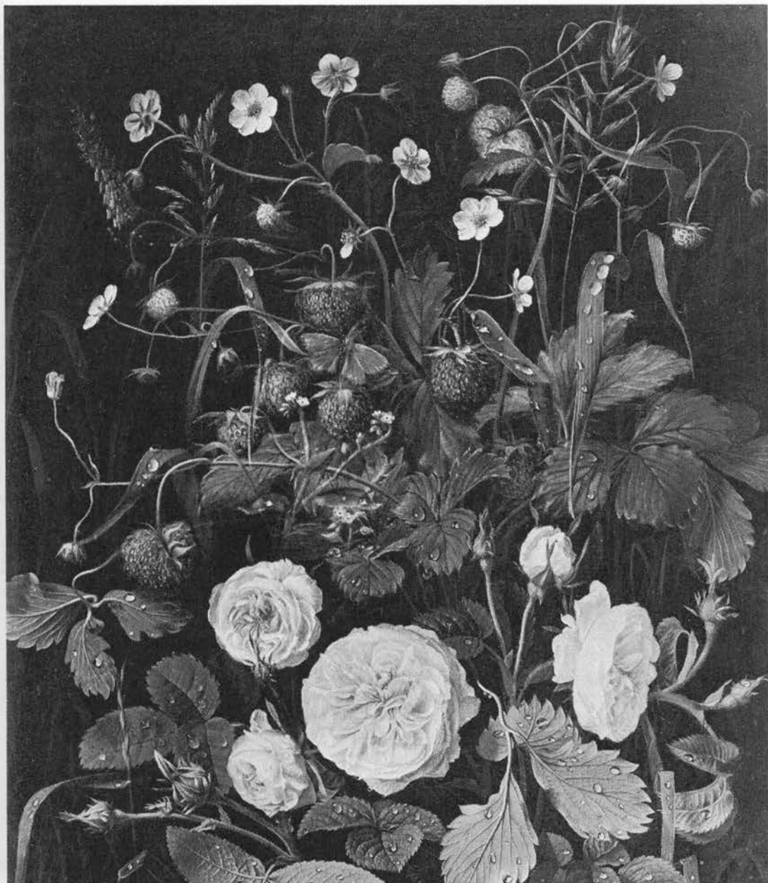
Skovjordbær med frugter og blomster blandt roser og græsser. Maleri af O. D. Ottesen, 1843.

pile stå langs vejen · og jordbær vokse røde, · med mindre I vil kede · den kommende slægt til døde Sophus Claussen (6).