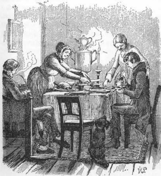
Illustration af Vilhelm Pedersen til H. C. Andersens »Under piletræet«.

Tørret krusemynte anvendes som krydderi i saucer, krydderekstrakt, friske blade i marinade, som grønt drys, i krusemyntegelé; knust mynte kan give drinks en fin og forfriskende smag; grønne skud af pebermynte anvendes til forskellige saucer, søde buddinger m.m. (17).