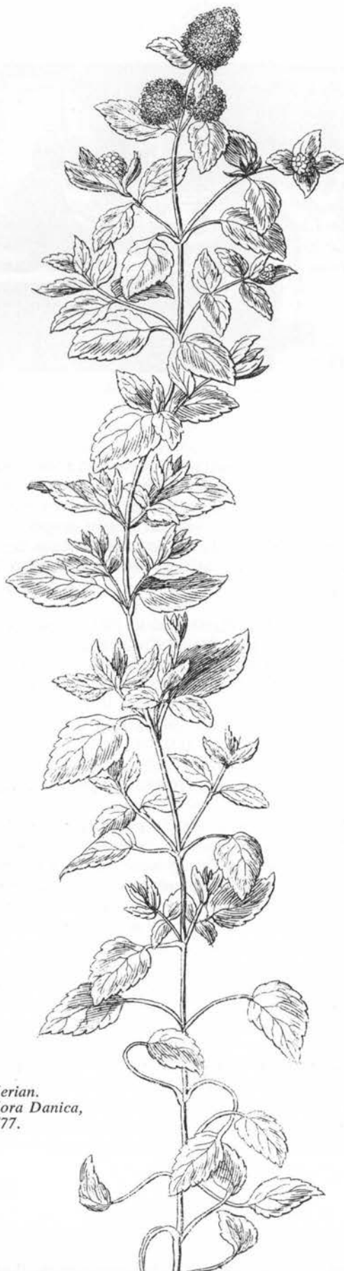
Merian. Flora Danica, 1777.

Med grøn mynte bundet på en lang stage gænger man bisværn i kuben (Bornholm; 9).