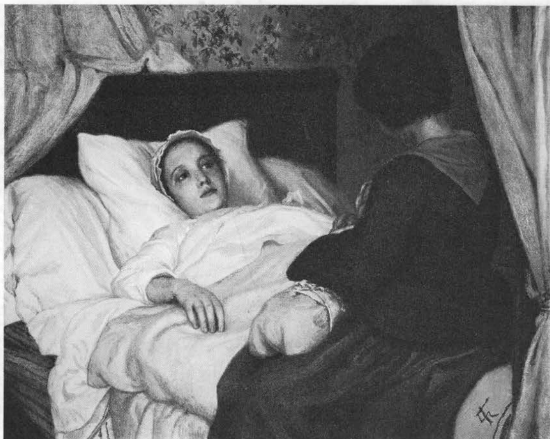
Malurt hjalp mod barselskvinders kvalme og anvendtes i en række tilfælde mod smerter i mave og bryst. Barselsscene malet af Lorenz Frölich.

27). Malurtsaft og klintemel lagt på navlen og maven skal dræbe børns orm; planten indgår i andre råd for indvoldsorm (54).