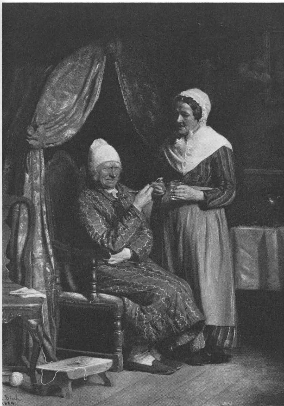
»Bitter medicin«. Maleri af Carl Bloch, 1884.