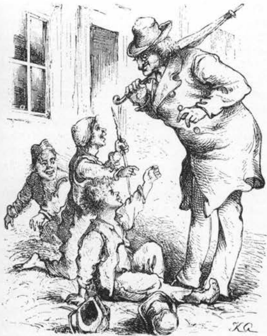
Gadedrenge med loppefangst. Træsnit i Folkekalender for Danmark, 1875.

(111) 576 7,98f; (112) 830 6,1886,68 (Flemløse); (113) 83 283,288; (114) 398 1806,747; (115) 83 302,308,311; 665b 6.