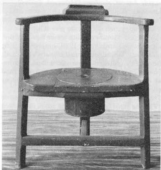
Afkog af mælkebøttens rod blev bl. a. anvendt som afførende middel. Natstol af fyrretræ. Dansk Folkemuseum, Brede.

Roden indgår i en brystte (o. 1820; 5), gammel kone på Hindsholm NFyn sagde, at afkog af planten hjalp for brystsyge = tuberkulose (1916; 6).