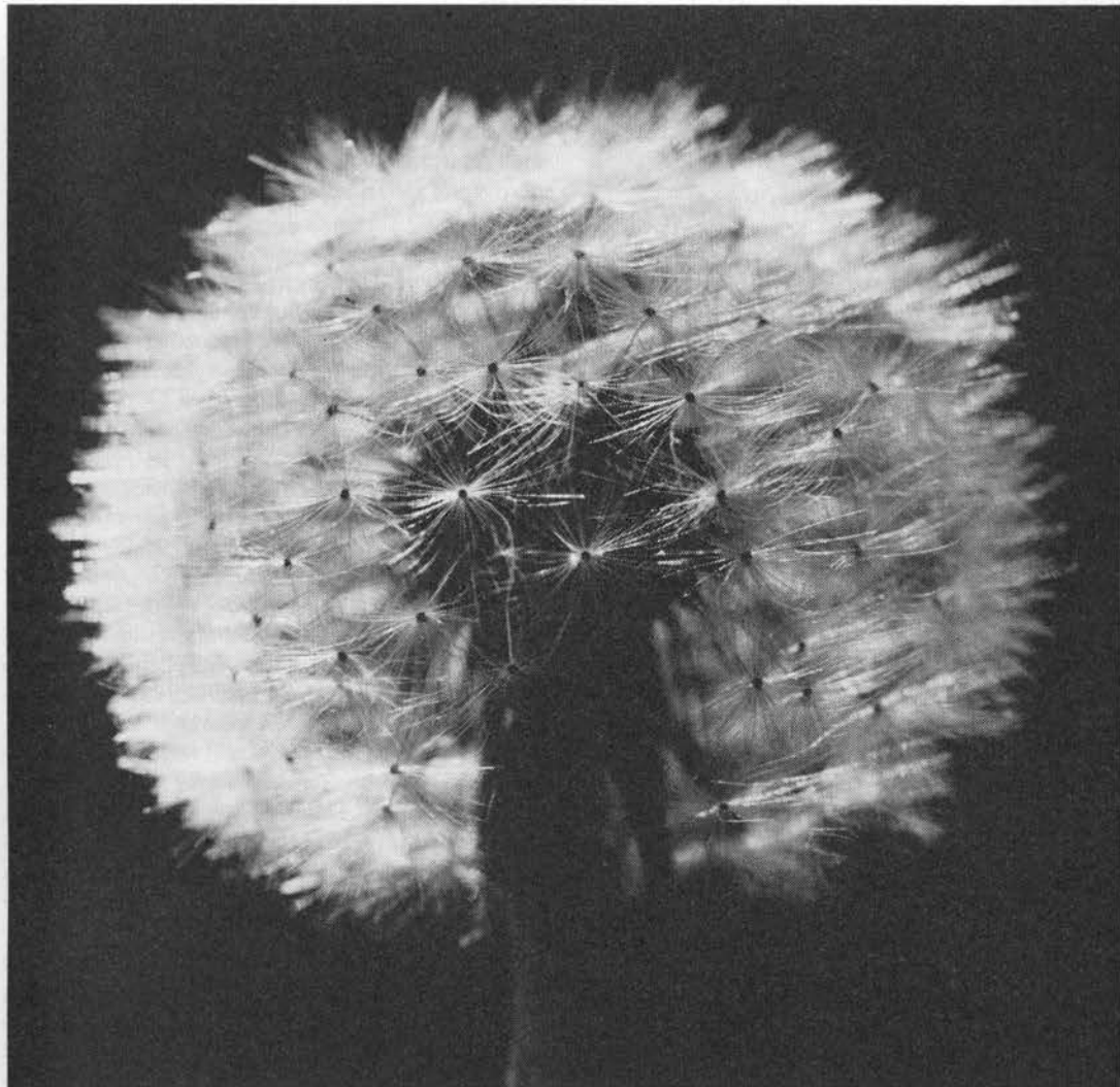
Frugtstand af mælkebøtte. (ES).

eller saladier om politiets udrykningsvogn med stålgytter for vinduerne, men i Danmark, hvor det nævnte køkkenredskab var ukendt, blev -kurv til -fad (jf. »komme i fedtefadet«), at køretøjet var mørkegrønt har sikkert også bidraget til øgenavnet salatfad (3).