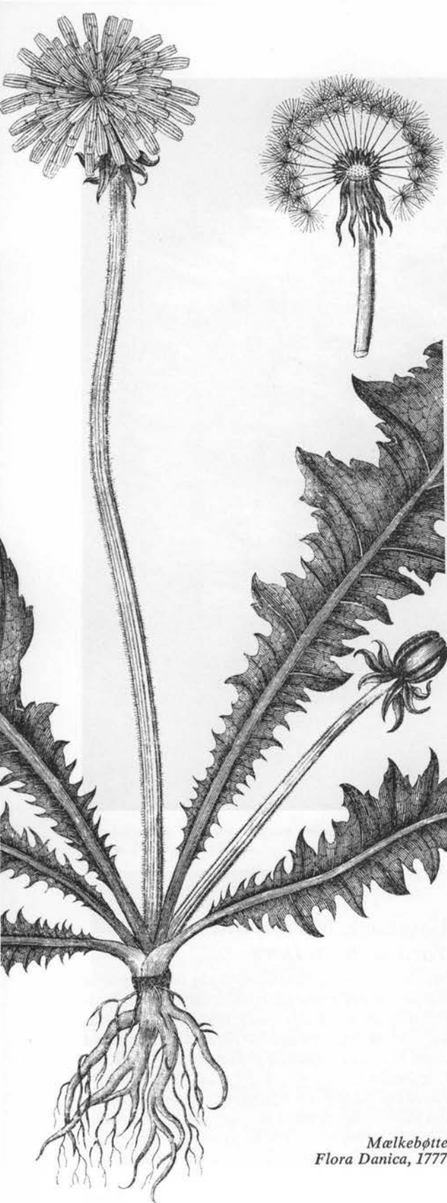
Mælkebøtte. Flora Danica, 1777.

ger's Aladdin), navnet skyldes dels plantens hvide saft, dels den nøgne tjavsede frugtbinds lighed med skindlåget på mælkespand af træ (for at hindre mælken i at skvulpe over), således som det endnu bruges på Færøerne, jf. nedenfor; mælkesaften »ser så tiltalende ud, men smager så bittert, sådan som fanden selv vist i virkeligheden« (2).