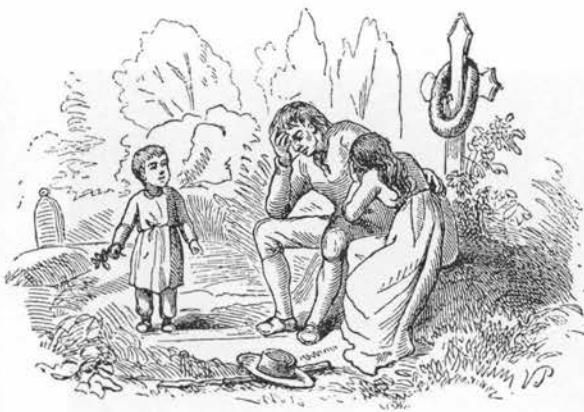
Vinca blev ofte indflettet i gravkranse. Tegning af Vilhelm Pedersen til H. C. Andersens eventyr »Den sidste perle«.

Planten nævnes blandt råd for hestens krop eller kværke, bladene mod dens ukendte sygdomme (7).