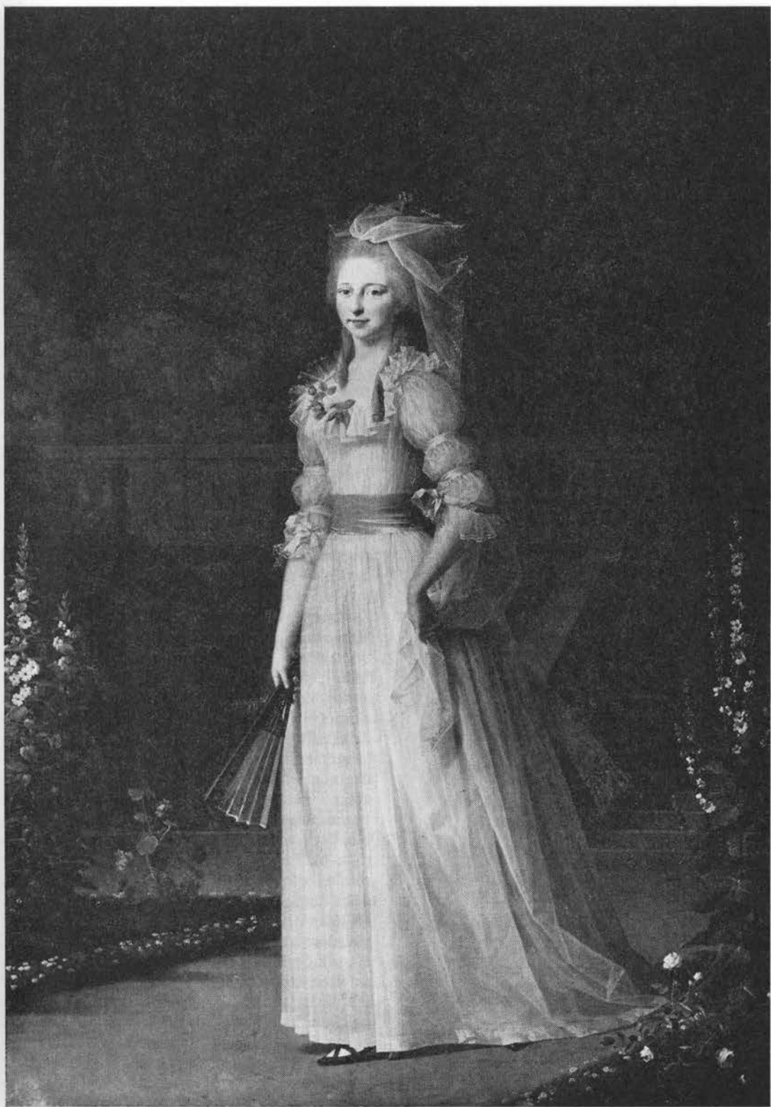
Kongelys flankerer hertuginde Louise Augusta af Augustenborg. Jens Juel, 1787.