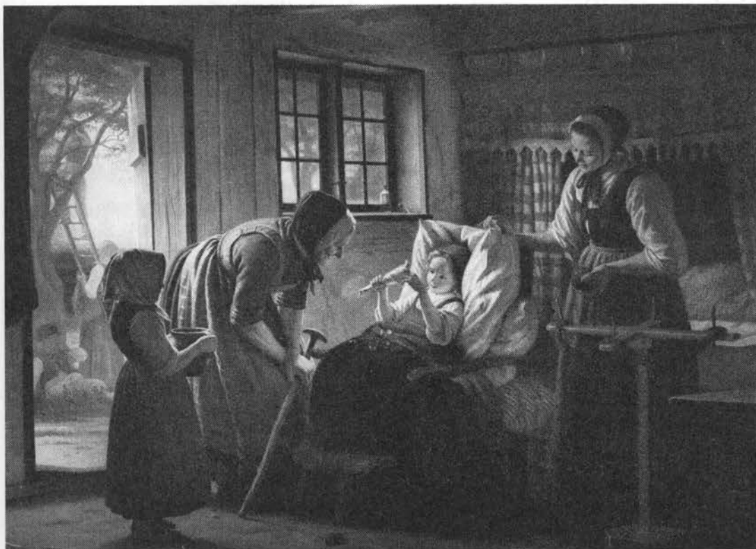
Den lille rekonvalescent får friskplukkede kirsebær fra haven. Maleri af Julius Exner, 1867.

Til gætteleg blev brugt kirsebærsten holdt i lukket hånd, se hassel bd. 1. De er ofte skyts i drenges slangebøsser. En lille kirsebærsten lagt i pilefløjtes lydhul giver en trillelyd. Børn har af kirsekærkærner udskåret bittesmå kurve (27). Harpiksen trækkes ud i lange tråde og spises, eller klumper tygges (28).