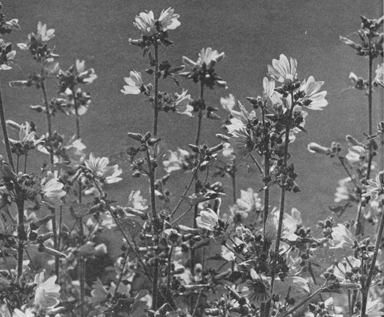
Almindelig katost. (ES).