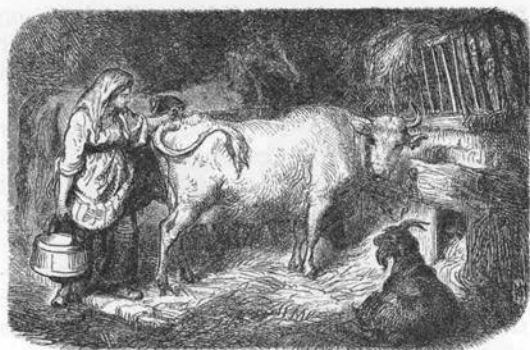
Kreaturene fik kalmusrod som kosttilskud for at forbedre mælkens kvalitet. Tegning af Lorenz Frølich i Ude og Hjemme 12-11-1882.

banghed«; dårlig ånde fordrives, når man tygger på den tørrede rod, i pesttider gør den luften sund; pulveriseret og drukket i kørvelvand som sveddrivende for at »løsne det blod, som er løbet sammen« efter slag og stød.