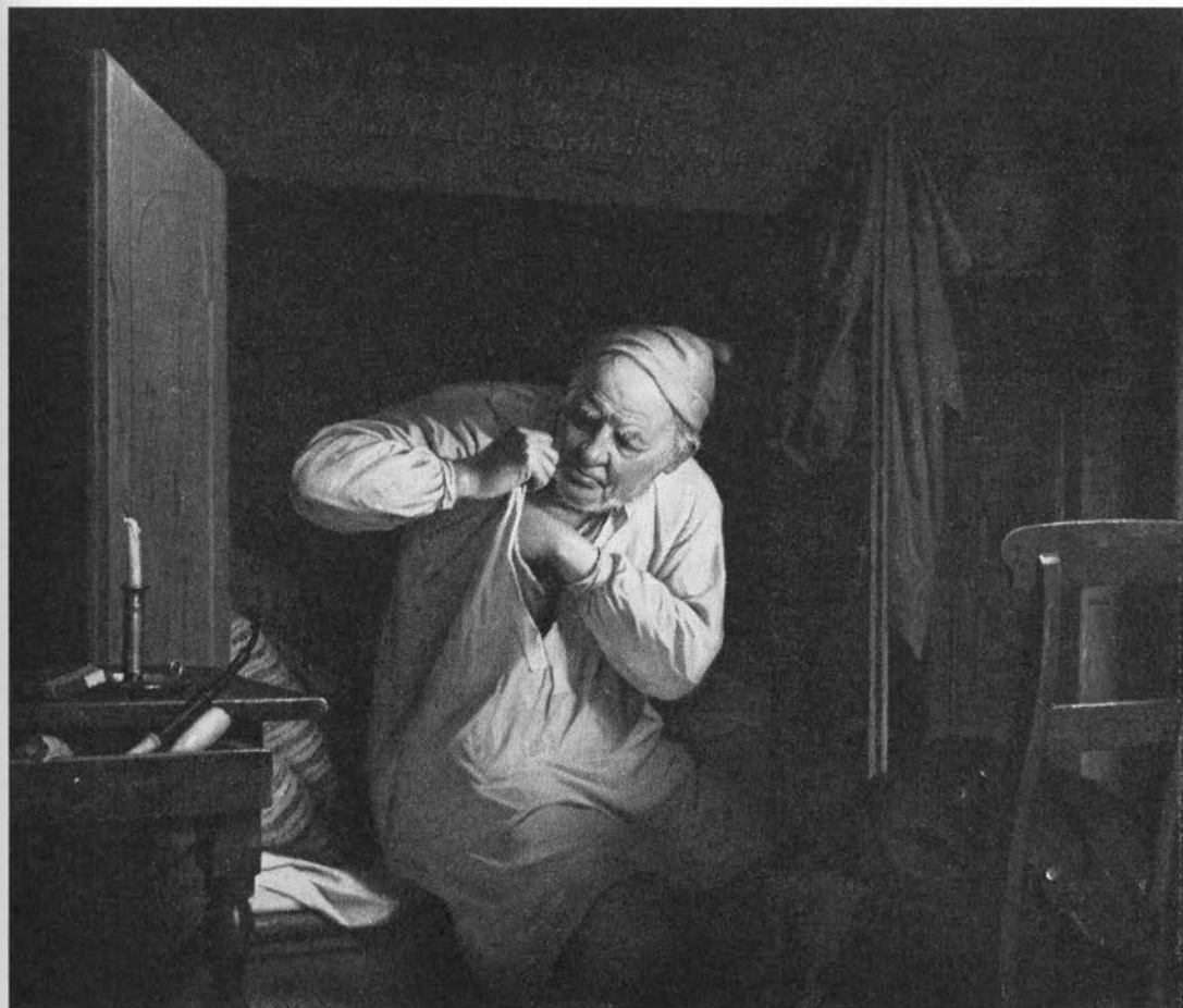
Bonde på sengekanten fanger lopper. Utøj var en udbredt plage og bekæmpedes bl.a. ved at lægge kalmus i sengehalmen. Maleri af Julius Exner, 1900.

skåret i terninger; udtrækket bliver også hældt på forbindingen (Vendsyssel o. 1900; 34). – Er indgivet for svins opkastning (32) og er bestanddel af råd mod fejl hos gæs (29). – Dyr-læger anvender roden som mavestyrkende og appetitvækkende middel (7).