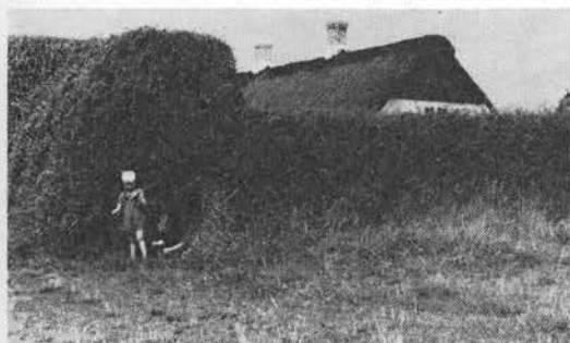
Klipet hæk af bukketorn. Sønderho. (HV).

ild (udslæt); den for kraftige menstruation stilles af tampon vædet med saften og anbragt i vagina; saften blandet med æggehvite lægges på rindende øjne, til åbne rindende sår må saften blandes med blyhvidt og sølvvælgød til en salve.