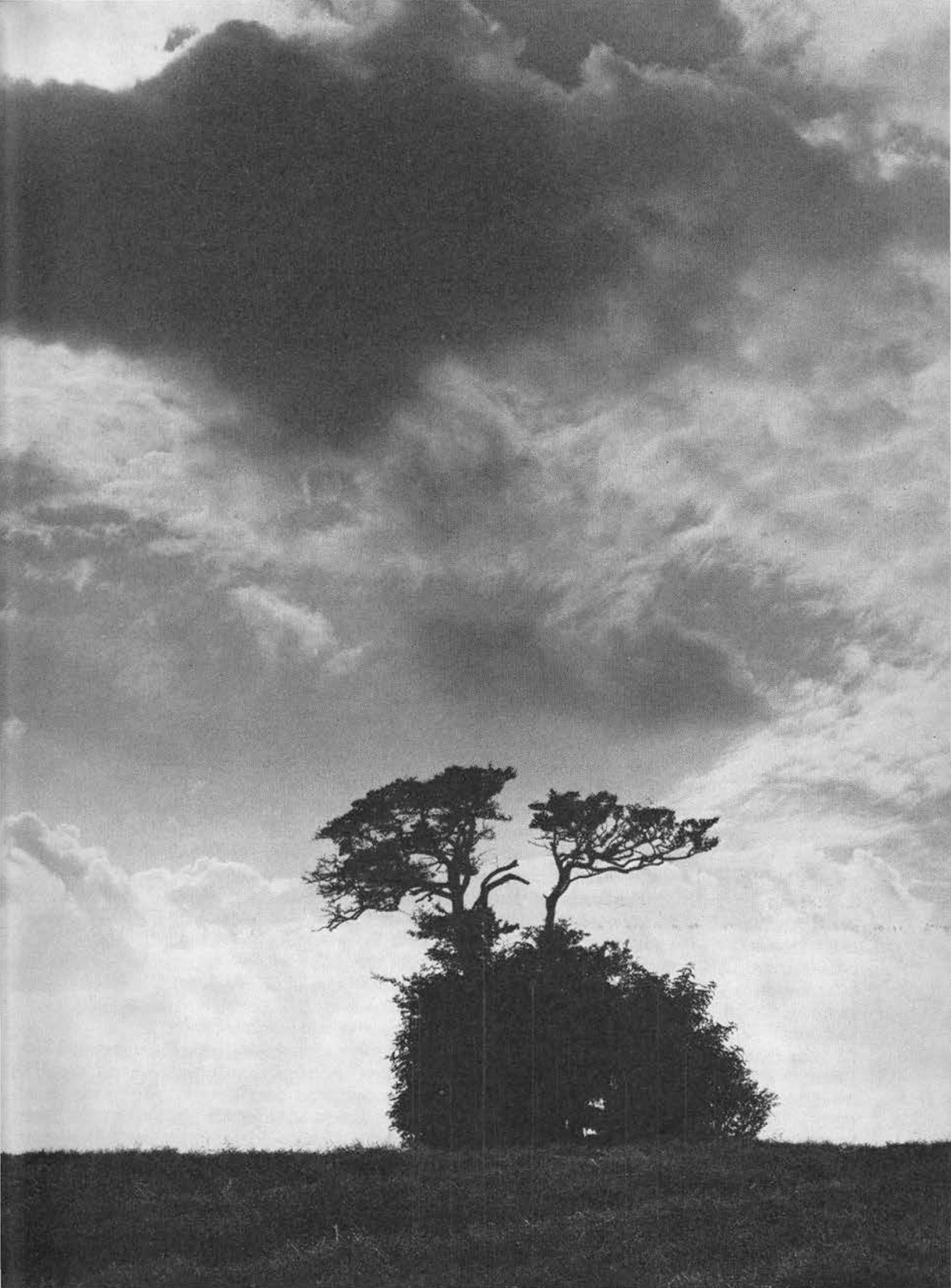
Pesttjørne ved Ertebjerg på Als.