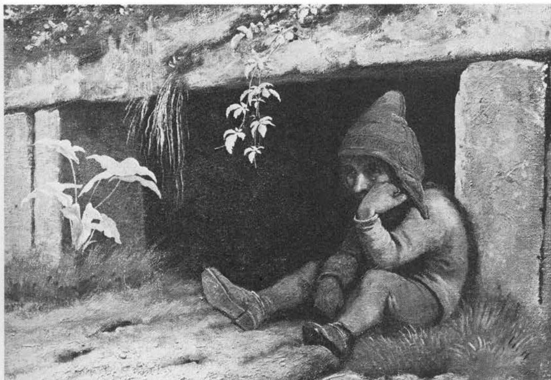
Det var gammel folketro, at de underjordiske væsener holdt til under tjørn. »Bakketrollden Sindre udenfor sin hule«, maleri af J. Th. Lundbye, 1845.

Ved Nyborg plantede en mand tre tjørne i sin mark, så måtte heksene ride uden om (7). Piskes fløden med en tjørneklase og kastes fløden i ilden klokken 24, bliver heksen, der stjal smørret, forbrændt og afsløret (Græsted NSjælland; 8). Æg fundet ved vej eller sti kunne være lagt der af ondt menneske, men piskede man dem med en tjørnekæp, var de uskadelige (9). Hårdusk af mareredet hest skulle hænges i tjørnebusk, så slap dyret – maren red da i tjørnen (Bornholm; 10).