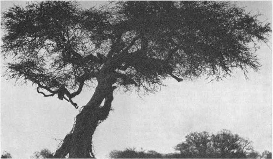
Hvidtjørn efter løvfald. (ES).