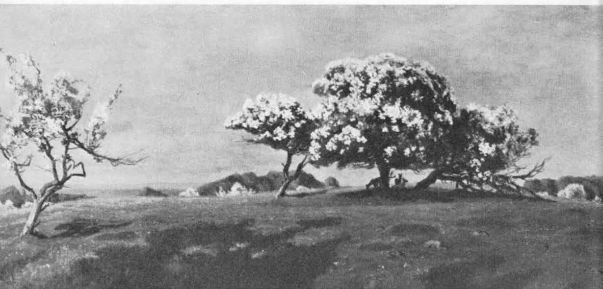
Blomstrende tjørne på Eremitagesletten med udsigt over Øresund. Maleri af Th. Niss, 1885.

LITTERATUR: (1) 343 88,167; (2) 15 53; (3) 696 160; (4) 902j; (5) 161 1906/23:3244; (6) 1009 1957, 27.