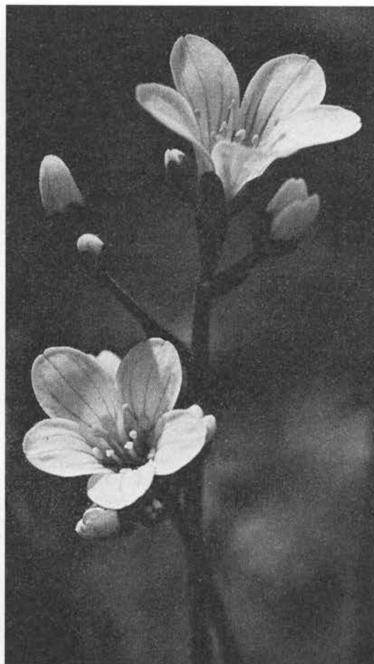
Blomstrende stenbræk. (EH).

Navnet stenbræk kendes fra o. 1450 og skyldes (ligesom det botaniske slægtsnavn) en tidligere anvendelse mod blære- og nyresten (s. 42), yngleknopperne ligner sten og planten gror mellem sten, i mursprækker etc., som den tilsyneladende har sprængt, sml. stenurt s. 34. Stenpikke o. 1700, pikke = lille spids stenham-