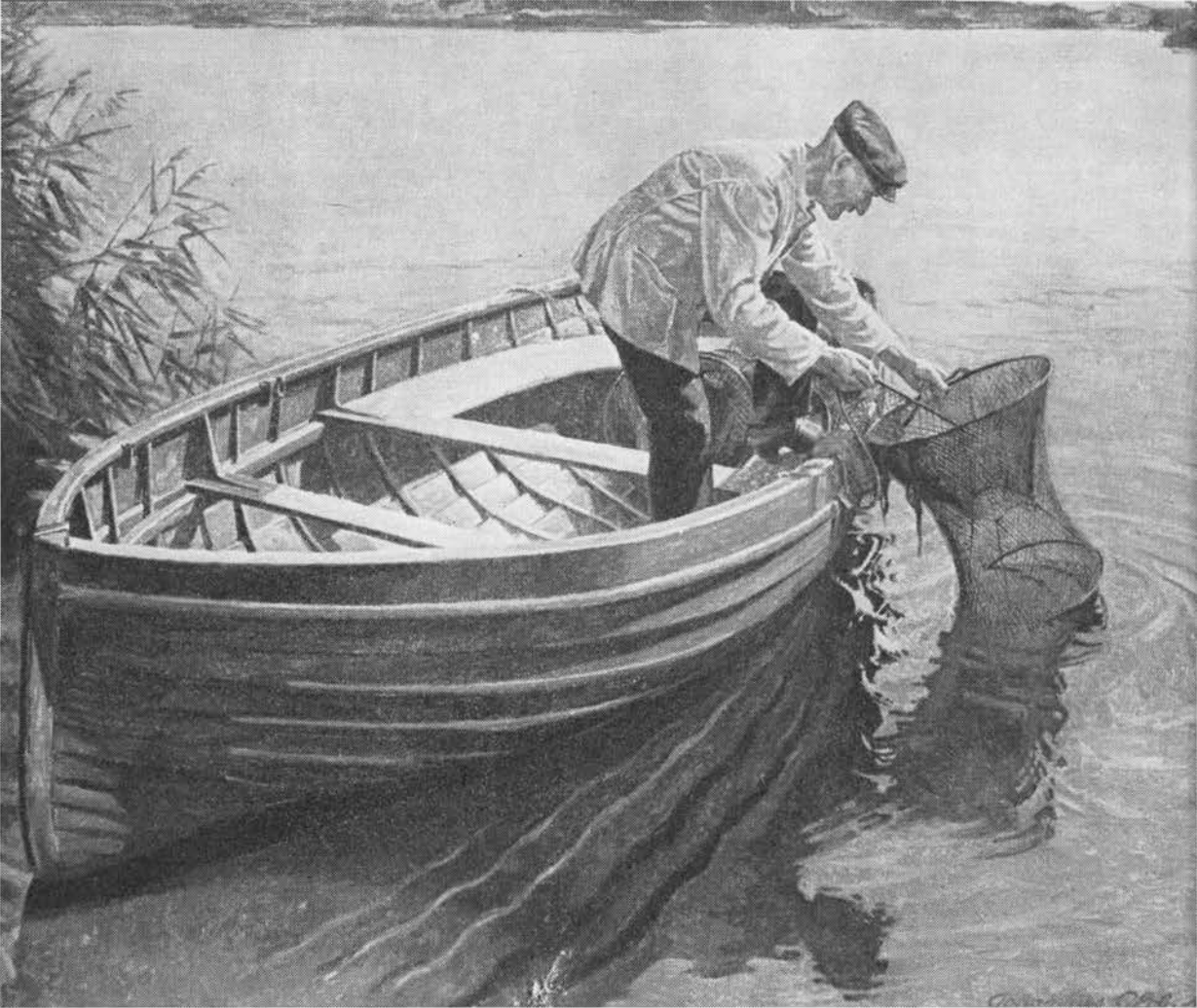
Soft af husløg skulle efter sigende kunne lokke fisk i ruserne. Maleri af Johannes Glob, 1945.

(11) 282 1852,10; (12) 718 1837,139f; (13) 488o 203; (14) 161 1906/23:403; (15) 488o 167; (16) 328f 1, 197 (NVJyll.); 161 1906/23:683 (Bornh.); (17) 488 9,1888,383; 1008 4,1916,524 jf. 488o 219; (18) 360 1,1914,144; 783b (Langel. o. 1875); (19) 379 1932, 322 (Hillerslev s.); (20) 488o 145; 1008 4,1916,531; (21) 519 47f; (22) 468 2,18; (23) 944b 200; 634 12204 (Thy o. 1900); (24) 273 184f; (25) 340 94; (26) 161 1906/23:443; (27) 161 1906/23: 622; (28) 634 19105 (Sønderjyll. o. 1890); 126 31 (NFyn o. 1830) jf. 488o 119; (29) 92 31,1947133; 449 1950, 27 (o. 1890); (30) 322 1806,227f; 718 1837,140; 32 50; 161 1906/23:3285 og 3312 (SSlesv.); 228e 1,689 (Vendsyssel); 634 12233, 13620 (Vends.), 15149 (V. Hanh.), 12191 (Læsø); 278 1939,43 (Lyø); 449 1950, 27; (31) 638 3,1840-41,130; (32) 161 1906/23: 3335; (33) 822 148; (34) 322 1806,227f jf. 182 4,1807,