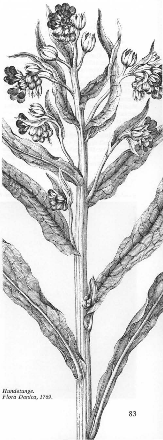
Hundetunge. Flora Danica, 1769.

Toårig 30-80 cm høj gråfiltet og ildelugtende plante, det 1. år med roset af lancetformede