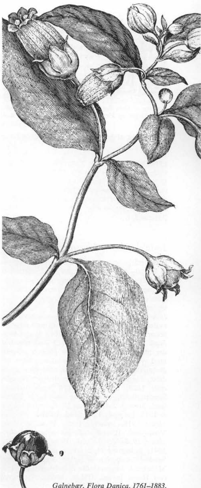
Galnebr. Flora Danica, 1761–1883.

Brrenes giftstof atropin benyttes nu af jenlger til udvidelse af pupillen fr operationer, et ekstrakt blev forhen af samme grund brugt som sknhedsmiddel (belladonna = smuk kvinde). Atropin gives for nervs astma og nattesved, i prparater mod mavekrampe og neuralgi (11). Apoteker frer extractum belladonnae.