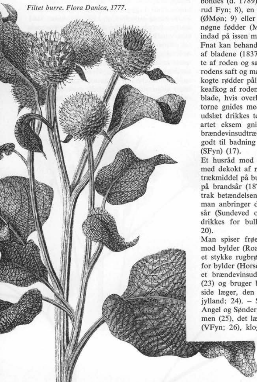
Filtet burre. Flora Danica , 1777.