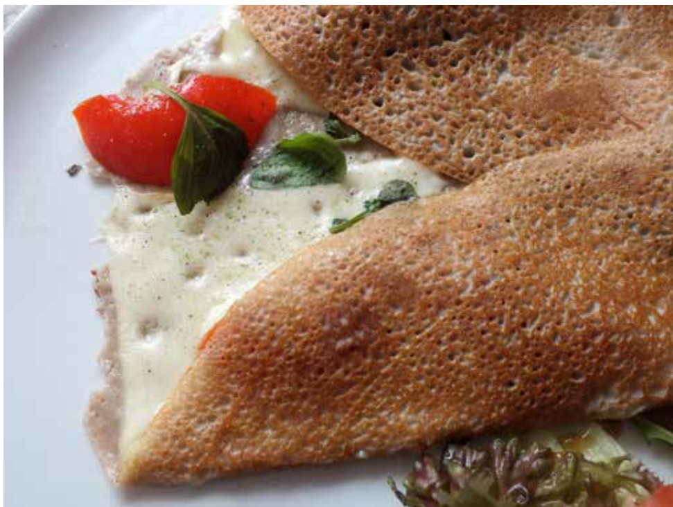
Galette, franska bovetepannkakor, har tillsammans med crêpes blivit populära i Skandinavien under de senaste decennierna.

Nordfynske hjem opbevarede gerne boghvedegrøden i små tønder, som stod i spisekammeret (ikke på loftet). Grøden kogt med mælk (eller vand, når der skulle spares) var nadverretten; undertiden fik man ovngrød bagt af gryd og mælk. Men oprindelig var boghvedegrøden nærmest en søndagsret; til hverdag spiste man bygrød. Det tarvelige boghvedemel kostede kun 6 skilling for et helt fjerdingkar fuldt og blev brugt lejlighedsvis, for at spare, til pandekager og melgrød. 27