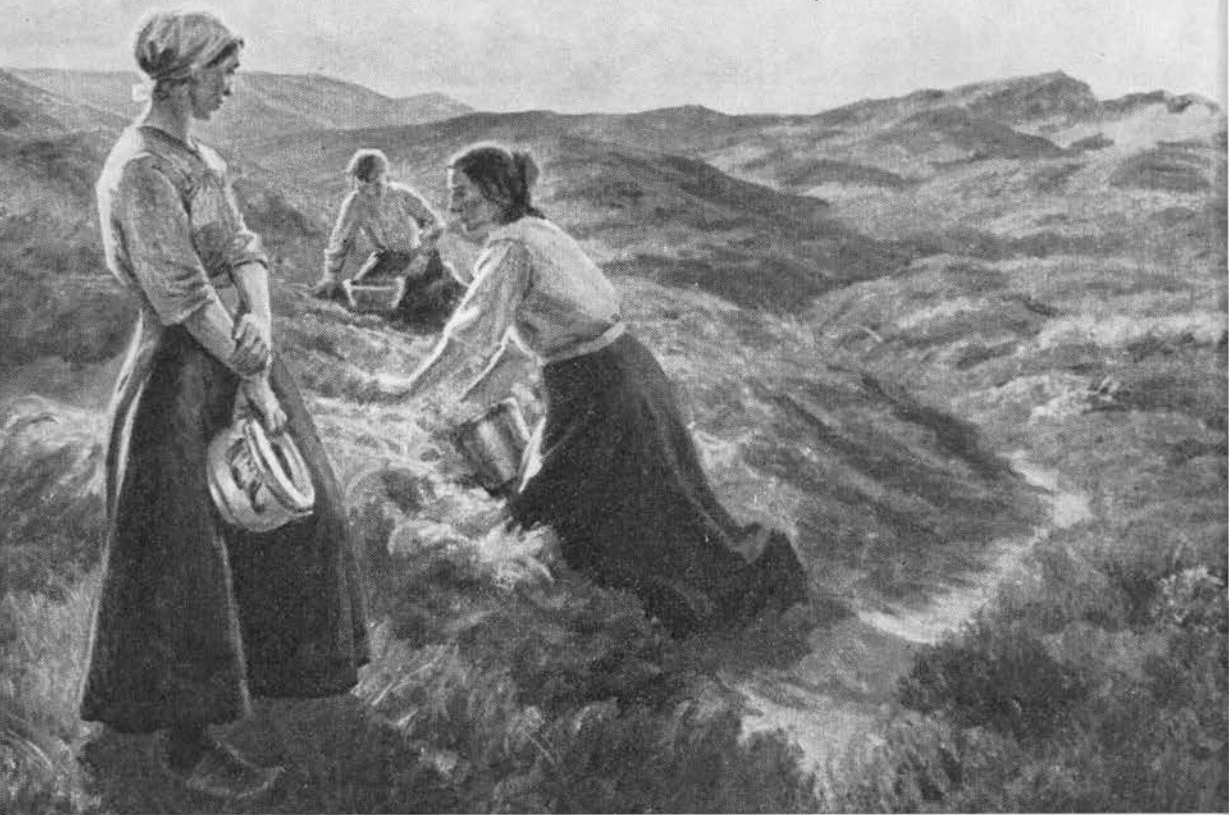
For fattigfolk var det i sæsonen en biindtægt at plukke og sælge hedens bær på torvet. Maleri af J. Wilhelm, 1924.