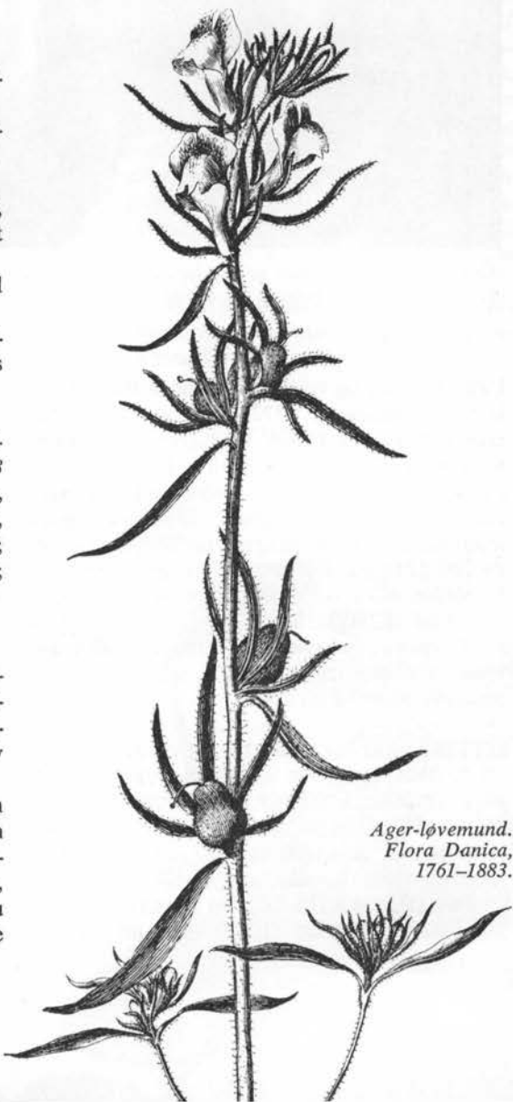
Ager-løvemund. Flora Danica, 1761-1883.

AGER-LØVEMUND, Antirrhinum orontium , som er hyppig på tørre marker mellem kornet på næsten alle de større øer, men mangler i store dele af Jylland, bliver 15–30 cm høj og har i bladhjørnerne enlige rosenrøde blomster med pukkel ved grunden af kronrøret, omgivet af fem lange bægerflige.