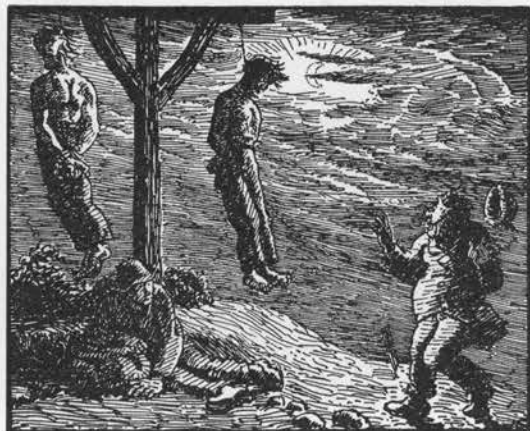
Scene fra galgebakken tegnet af Niels Skovgård i »Udvalgte sønderjydske folkesagn«, 1919.

LITTERATUR: 689 2,23f; 159 1930,63,65f; 690 1, 100 og 6,624f; 288 jf. 637 1925,13.