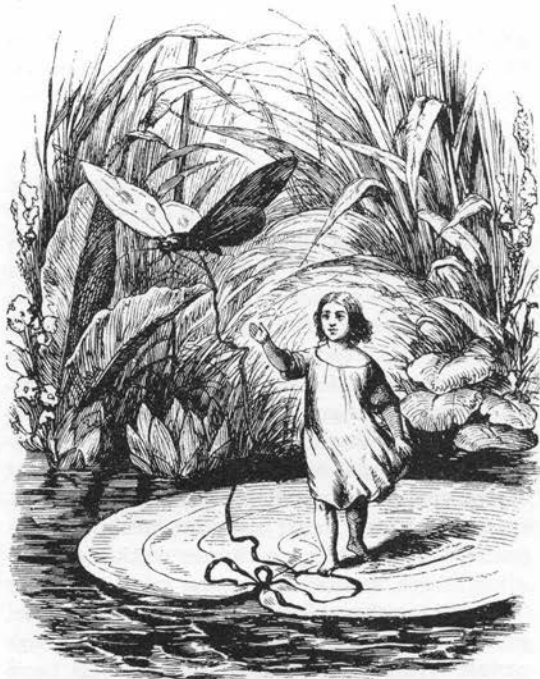
Tommelise på åkandebladet. Tegning af Vilhelm Pedersen til H. C. Andersens eventyr »Tommelise«.