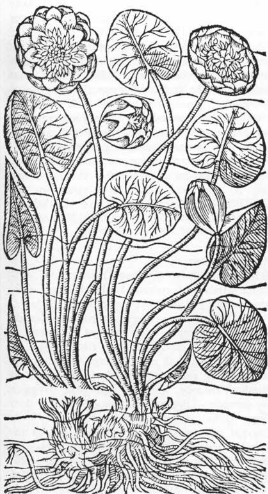
Nøkkerose og gul åkande. Simon Paulli: Flora Danica , 1648.

Christiern Pedersen 1533: ølafkog af »åkanderod« eller destilleret vand af blomsterne drikkes for at modvirke »den onde begæring og ukysk-