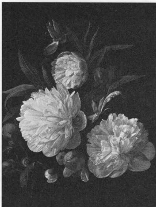
Bonderoser malet af C. Balsgaard, 1846.

Det gav sygdom i besætningen og uheld overhovedet at forære havens pæoner væk (Odsherred; 19), blev de flyttet, måtte man være forberedt på et snarligt dødsfald (Fakseegnen); den måtte ikke tages med, når man flyttede til en anden gård (Skagen) (20).